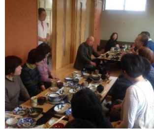
さおう料理「のうらく伸」にて

「食」をテーマにリンゴや梨の生産現場や、乳牛の牧場を見学しました。「アトリエテリス」や「のうらく伸」など、地元の飲食店の協力もいただき、毎回テーマにちなんだ昼食も楽しみました。参加者からは、「地元で面白いものが沢山あり、驚いた」という声が聞かれました。