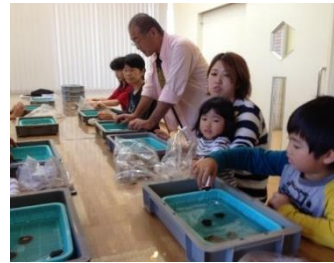
土器クリーニング

10月14日(日)、10月28日(日)、11月10日(土)の3回にわたり、蔵王の魅力を体験する講座「蔵王のお宝探検隊」を開催しました。1回目は「松川」をテーマに水晶探しや、砂防建造物を見学し、2回目は「縄文」をテーマに土器ひろい、クリーニング、石器づくり体験、3回目は