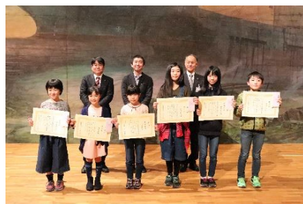
受賞された皆さん