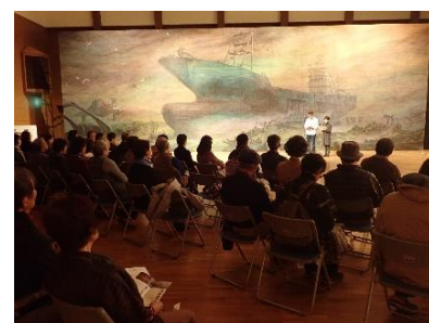
詩の朗読会の様子