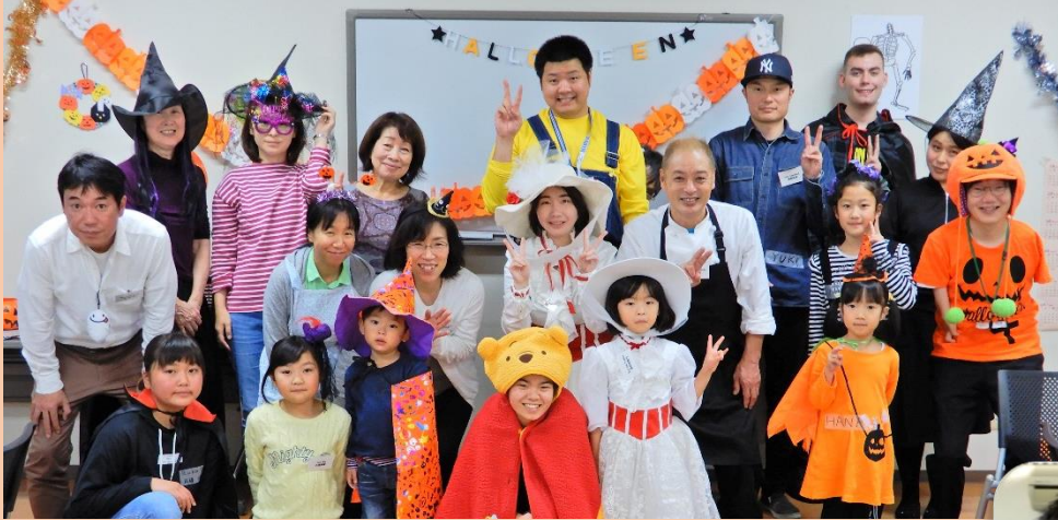
(写真は昨年度英会話教室で実施したハロウィンパーティーのもので)